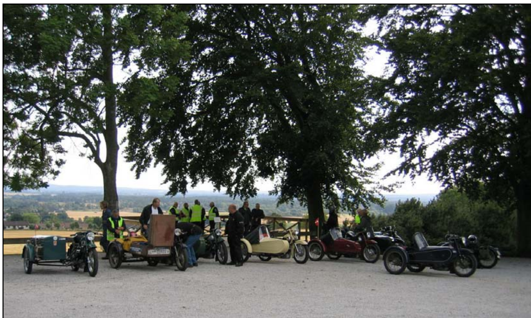
Parkeringsplatsen mitt emot Harlösa kyrka med utsikt över Vombsänkan i bakgrunden. Bilden är tagen vid sommarträffen 2008. Vi hade kört i Köpenhamn under dagen och detta var sista programpunkten innan kvällens samvaro.

från 1820-talet fram till 1888. Platsen var en ofruktbar grus- och sandhöjd och ortnamnet betyder röjningen på det sandiga området. Höjden, som var mera lönsam för byn att hyra ut till militären än att odla själv, finns inte kvar längre, sanden fick till sist sitt rätta värde. Grustakten startade på 1950-talet och har idag lämnat en populär badsjö som ett bestående spår i landskapet.