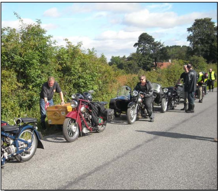
Det är en mycket speciell känsla att köra flera hundra nästan likadana motorcyklar tillsammans. Särskilt i Danmark där Nimbus är ett så välkänt märke.