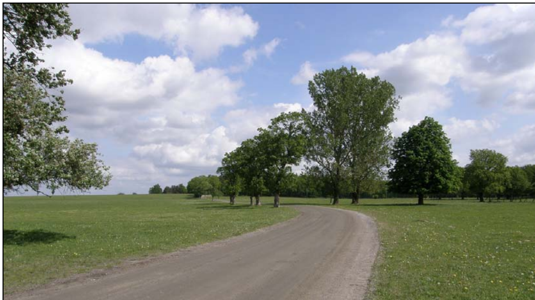
Öppet beteslandskap söder om Krankesjön från en sommartur 2011.