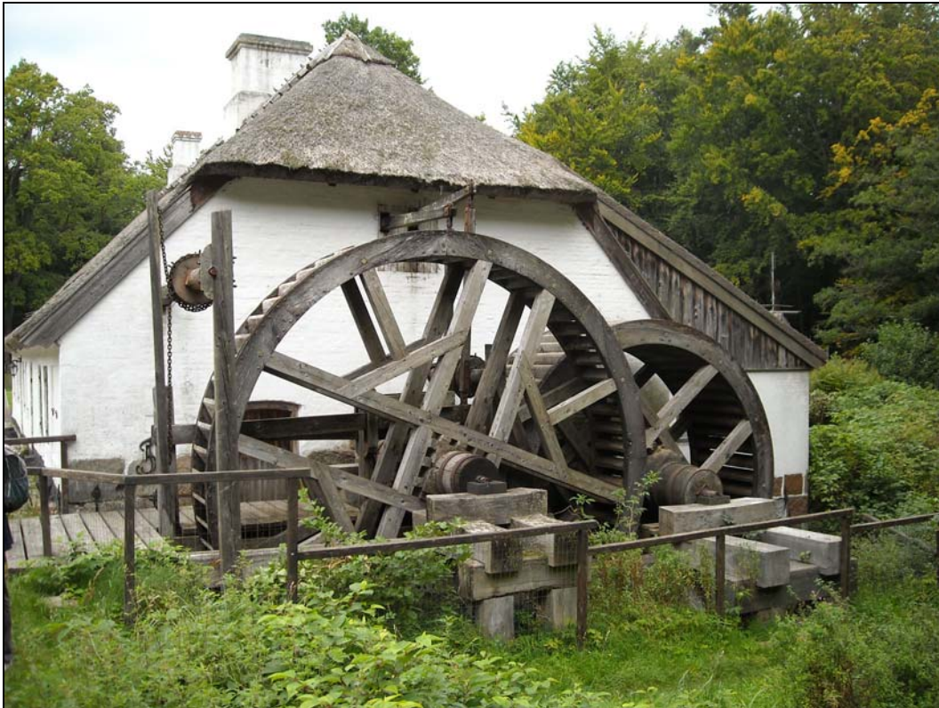
Hammermølle i norra utkanten av Helsingør, en renoverad vapensmedja. Härifrån startade orienteringsdelen av träffen.