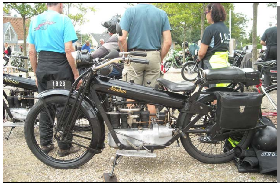
Rör från 1923