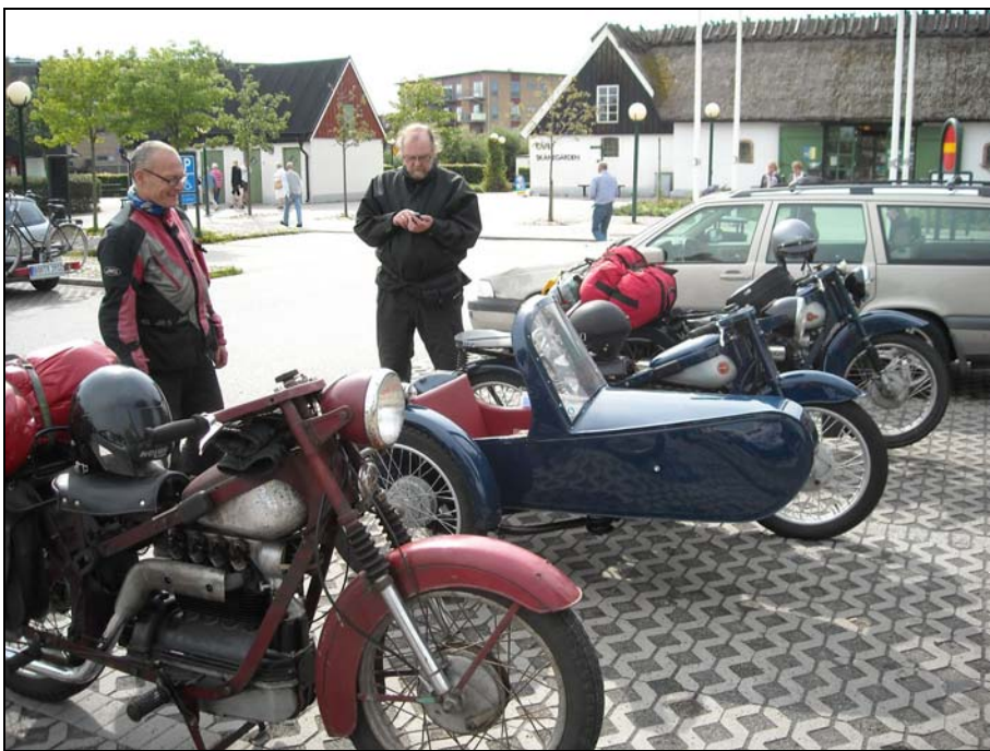
Återsamling på den svenska sidan av Sundet.