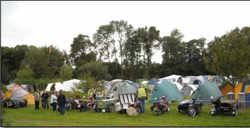
Årsträffen var förlagd till en mc-camping strax utanför Ringe helgen den 5-7 augusti. Till vänster syns lite av tältlägret