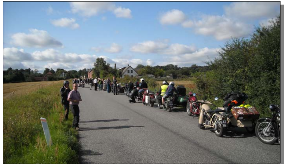
Två bilder från starten av den gemensamma körturen