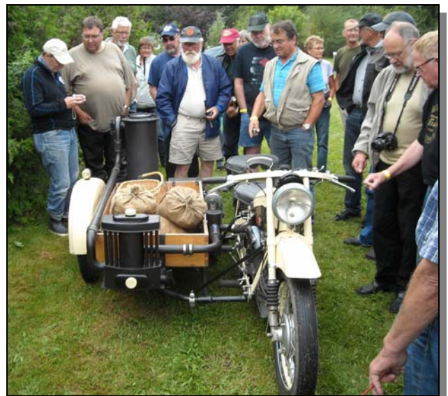
Efter påeldning rullade det gengasdrivna ekipaget iväg för att hämta Ringes borgmästare.