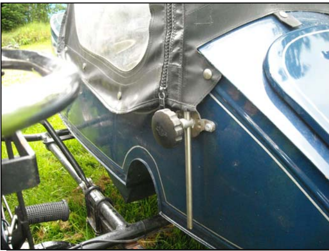
Sufflettstug med styrbromsratt.