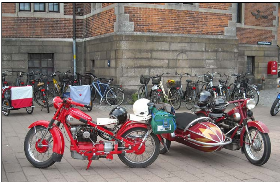
Från sommarträffen 2009. Två av cyklarna framför stationen i Helsingör.