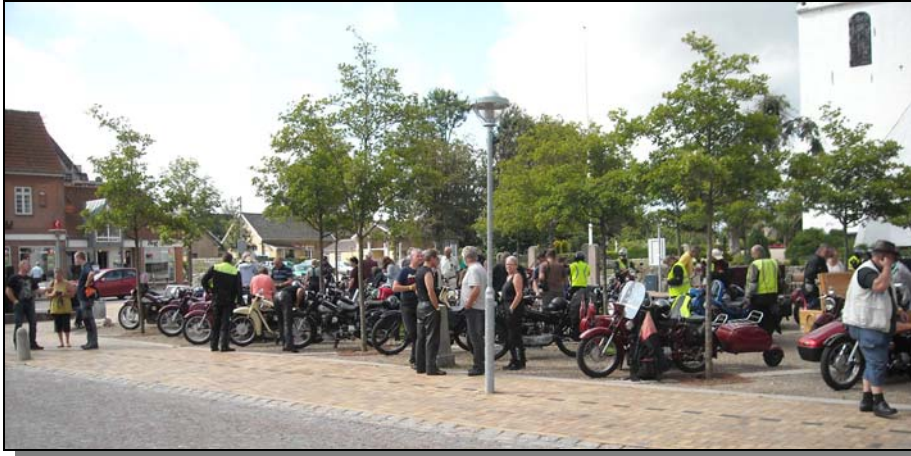
Turen avslutades med att våra motorcyklar fyllde de två torgen i Ringe