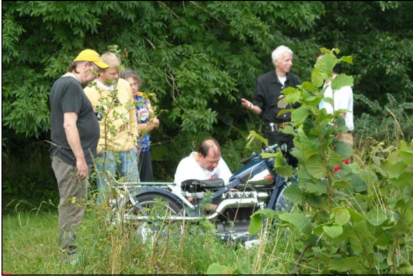
Flitigt skruvande i den svensk-amerikansk-danska delen av lägret.