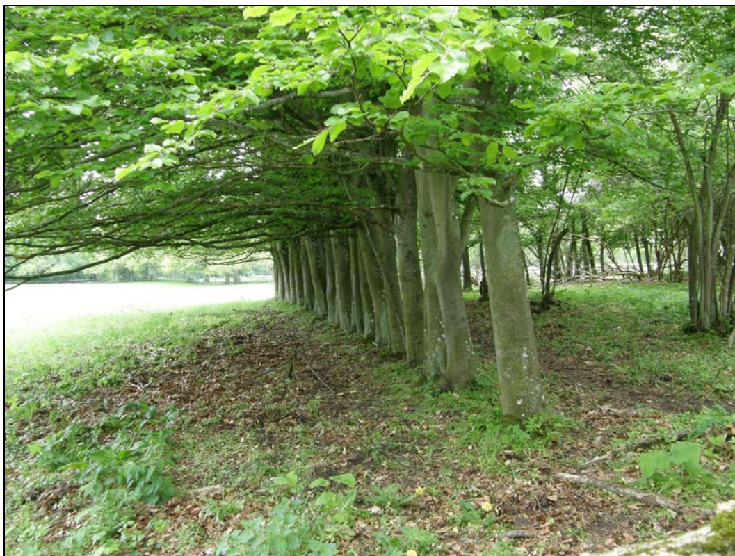
Förvuxen bokhäck vid en öde gårdsplats på Revingefältet

Nu har vi kommit fram till Silvåkra genom den långa allé som leder fram till byn från väster. Kyrkan, prästgården och ytterligare två gårdar blev kvar här efter enskiftet. Byns namn slipper vi inte ifrån. Det har inget med silver att göra, en av de gamla namnformerna är Sellagre men det hänger inte ihop med sill heller, vi är ju flera mil från kusten. Sell betyder här säl.